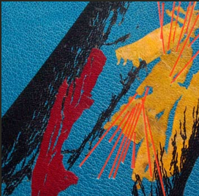
Détail de « El humo dormido » de José Vallejo Marchite. Relié par Llar del Llibre en 2002

Ecrivains alicantinains et alicantinains illustres: