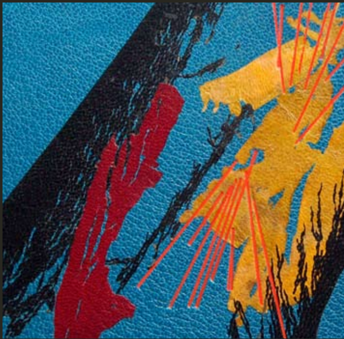
Detalle de "El humo dormido" de José Luis Vallejo Marchite. Encuadernado por LLAR DEL LLIBRE en 2002